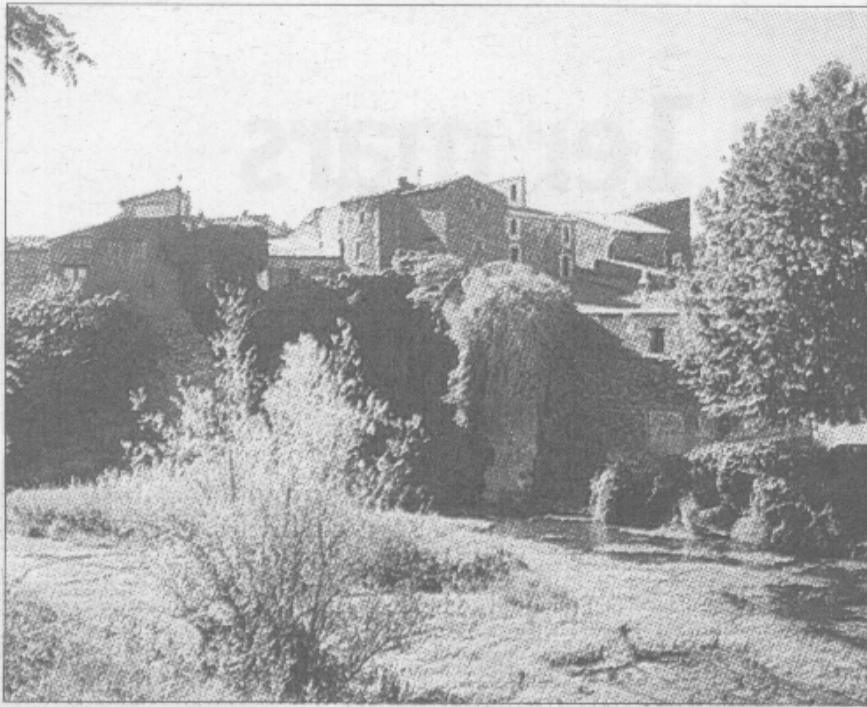
Le village de Gabian, dominant la Thongue