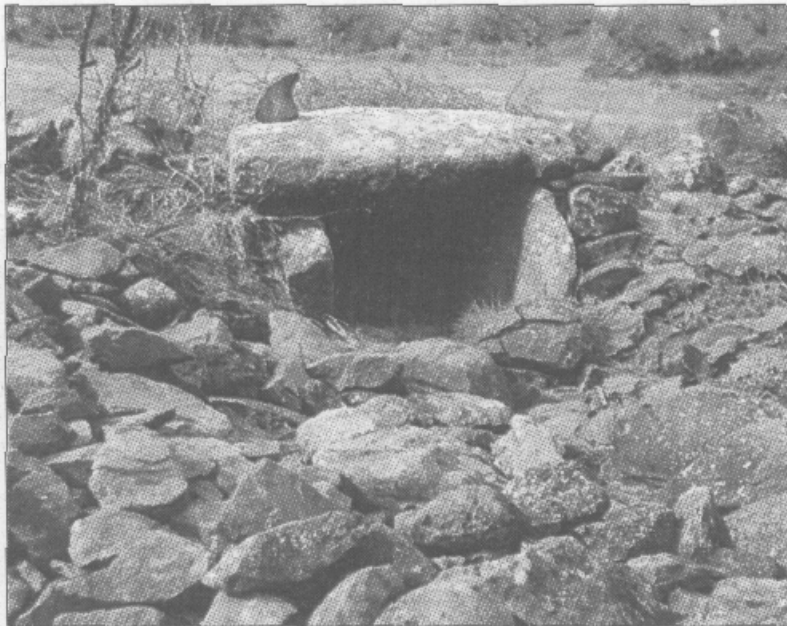
L'un des dolmens du causse de Toucou, tout près d'Octon et du lac du Salagou.