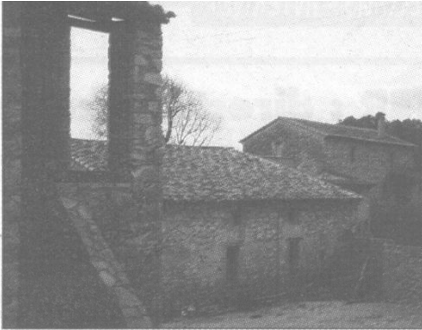
Le village de Coupiac, à quelques encâblures de l'abîme de Ravanel.