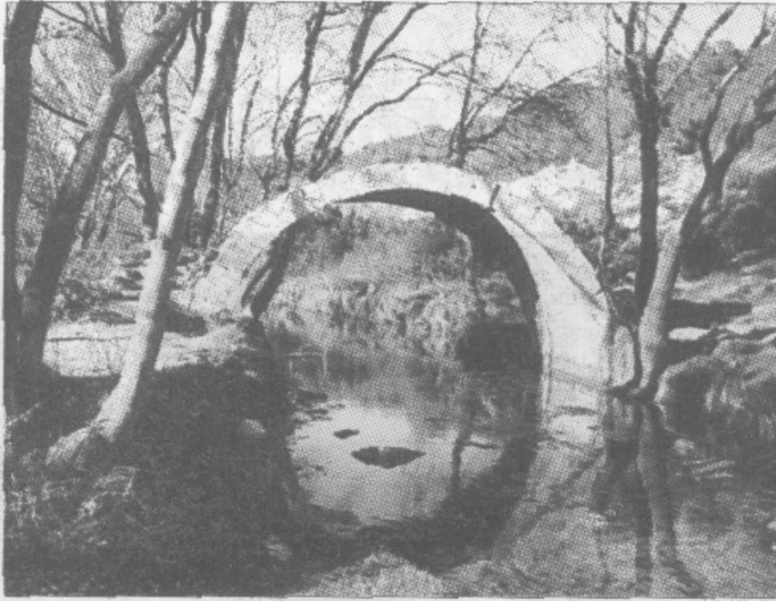
Au tiers de la balade, vous découvrez l'arche, vestige du pont romain sur la Cadoule